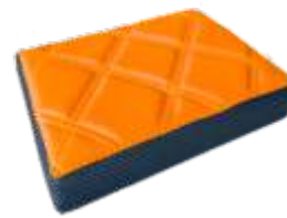
Laranja Sport Orange Sport