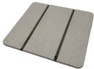
Teka Cinza Teka Grey