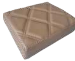
Marrom Escuro Dark Brown