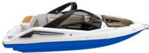
AZUL ROYAL ROYAL BLUE