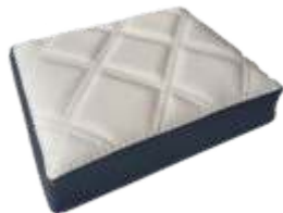
Bege Rolex Sport Rolex Beige Sport