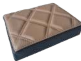
Marrom Escuro Sport Dark Brown Sport