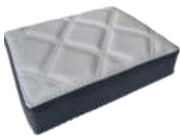
Light Platinum Sport Light Platinum Sport