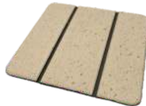
Teka Areia Teka Sand