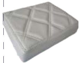
Cinza McLaren McLaren Grey