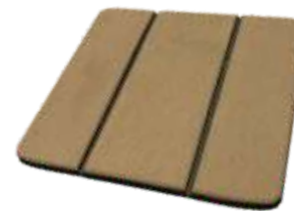
Teka Madeira Teka Wood