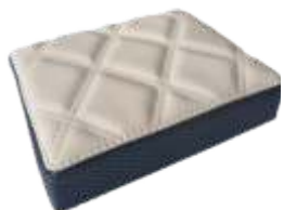
Bege Naval Sport Navy Bege Sport