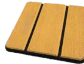
Madeira Claro Wood Light