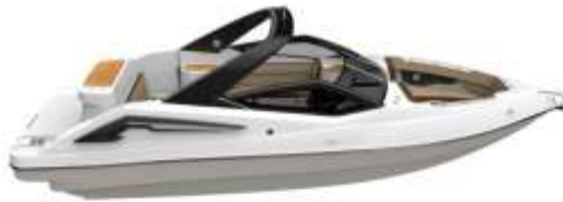
SILVER ARROW SILVER ARROW