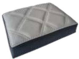
Cinza McLaren Sport McLaren Grey Sport