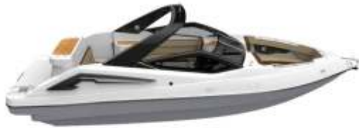
SHADOW GREY SHADOW GREY