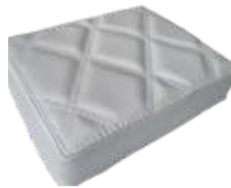
Light Platinum Light Platinum