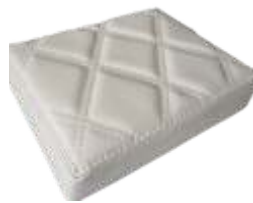
Bege Rolex Rolex Beige