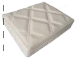
Bege Naval Navy Bege