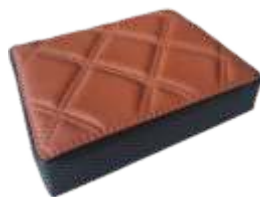
Terracota Sport Terracotta Sport